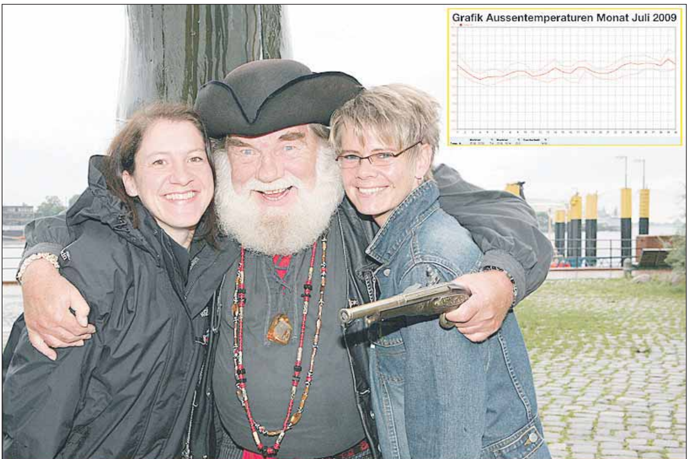
Grafik Aussentemperaturen Monat Juli 2009

Erfreuliches ist hingegen von den Besucherzahlen auf der Homepage der GEWOSIE-Wetterstation zu vermelden. Sie verzeichnet einen neuen Besucherrekord. 1.299 User wollten am 17. Juli das Wettergeschehen, unter anderem wohl den heftigen Sturm in den Vormittagsstunden, online und live über die Webcam der GEWOSIE verfolgen. DF